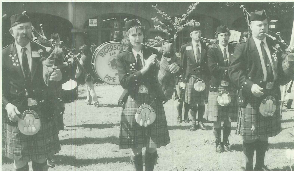
加拿大牛津郡風笛隊演奏

植樹所選擇的樹種，特別以馬偕博士在「最後的住家」詞中，所喻示「在竹林搖曳的陰影底下，找到我一生最後