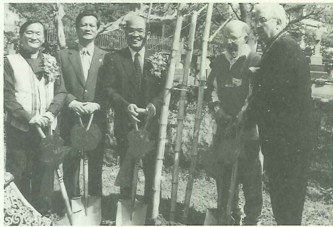
縣長蘇貞昌、鎮長郭哲道等共同植樹紀念

「誠願在生涯終了之時，在大浪拍岸的聲響中，在竹林搖曳的陰影底下，找到我一生最後的歸宿！！」