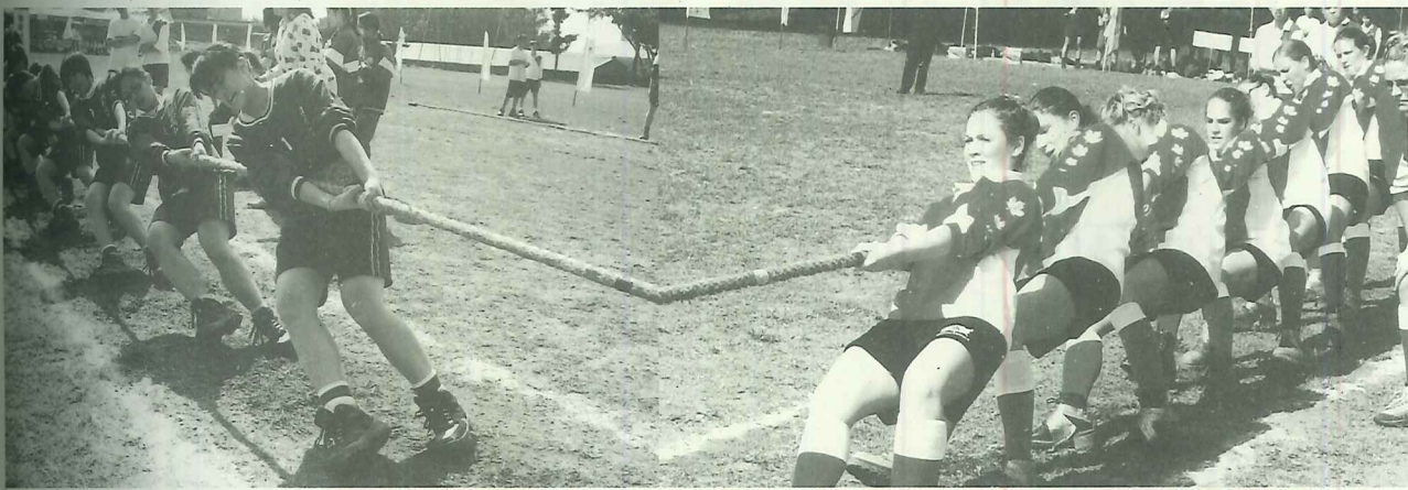
五股中學(右)與西松高中拔河較勁